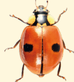
2 points Adalia bipunctata