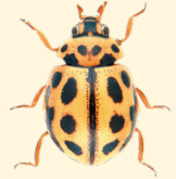
16 points Tytthaspis sedecimpunctata