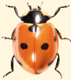
7 points Coccinella septempunctata