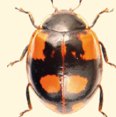
14 points Propylea quatuordecimpunctata