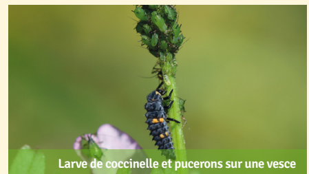
Larve de coccinelle et pucerons sur une vesce

Des ressources nectarifères et pollinifères peuvent aussi permettre aux coccinelles de survivre en l'absence de proies disponibles.